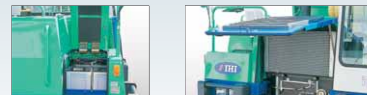
バッテリーカバー

全面カバーはワンタッチ開閉式、バッテリーカバーも開閉式を採用しています。また、機械各部にメンテナンスしやすい点検窓を設けました。スプロケットは4分割型を採用。ゴムクローラを外すことなく交換できます。